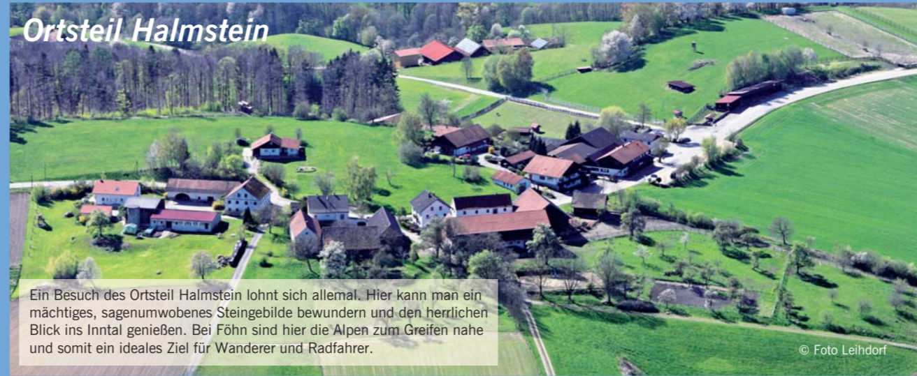
Ein Besuch des Ortsteil Halmstein lohnt sich allemal. Hier kann man ein mächtiges, sagenumwobenes Steingebilde bewundern und den herrlichen Blick ins Inntal genießen. Bei Föhn sind hier die Alpen zum Greifen nahe und somit ein ideales Ziel für Wanderer und Radfahrer.

REMBART HOLZ IM GARTEN Wallner 1 94094 Rothalmünster/Malching Tel.: 08536 862 Fax: 08536 1526 www.rembart.de info@rembart.de